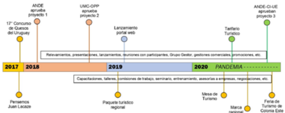
Figura 4. Línea de tiempo con principales sucesos

Uno de los efectos más significativos de este proyecto fue la conformación nuevamente de una Mesa de Turismo dentro de ADE del Este, abierta a todos los prestadores de servicios de la microrregión que fueron participando en el proceso del proyecto (del centenar, los más asiduos eran poco más de veinte). El proceso de creación y puesta en funcionamiento abarcó todo el año 2020, con la expectativa de seguir reuniéndose y consolidarla en el año siguiente.