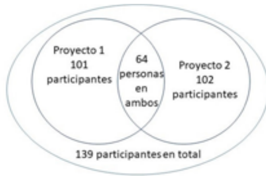
Figura 3.

Se exploraron insistentemente distintas estrategias para dar a conocer el destino turístico en su conjunto y lograr su comercialización fuera del departamento de Colonia, hasta que se comenzaron a abrir las puertas adecuadas recién sobre el final del plazo original de año y medio, pero, debido a la pandemia, no se reflejó en la llegada de más visitantes y turistas. Brotes de covid-19 en la región Este en el segundo semestre de 2020 frenaron las mejores expectativas que la situación permitía para la primavera y el verano que se avecinaban.