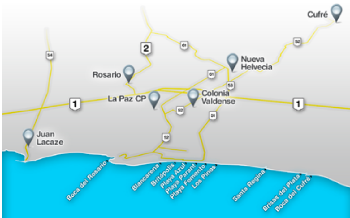
Figura 2. Representación aproximada de la microrregión Este del departamento de Colonia (no a escala).