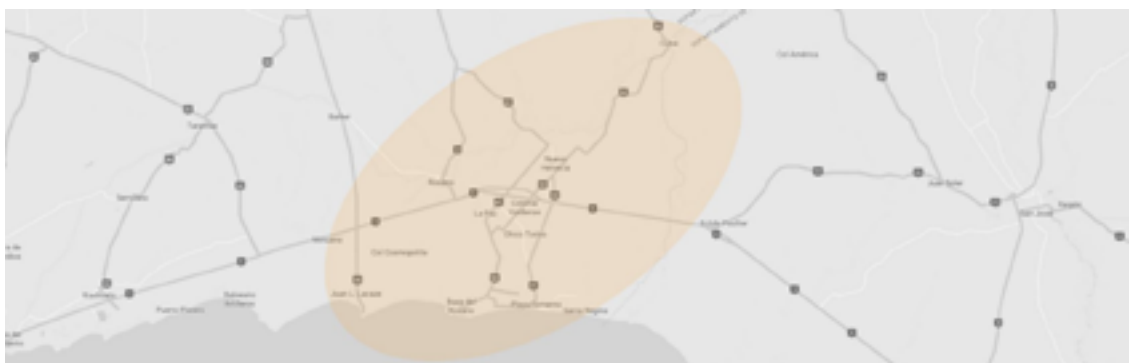
Figura 1. Representación aproximada de la microrregión Este del departamento de Colonia

Esta microrregión comprende cuatro ciudades pequeñas (Colonia Valdense, Juan Lacaze, Nueva Helvecia y Rosario), pueblos y localidades más chicas aún como Barker, Concordia, Cufre, La Paz CP, 1 Paraje Minuano; y una cadena de balnearios desde Brisas del Plata en el extremo este, Santa Regina, Los Pinos, Playa Fomento, Playa Parant, Playa Azul, Britópolis, hasta Blancarena junto a la desembocadura del río Rosario, en el extremo oeste de esa línea costera.